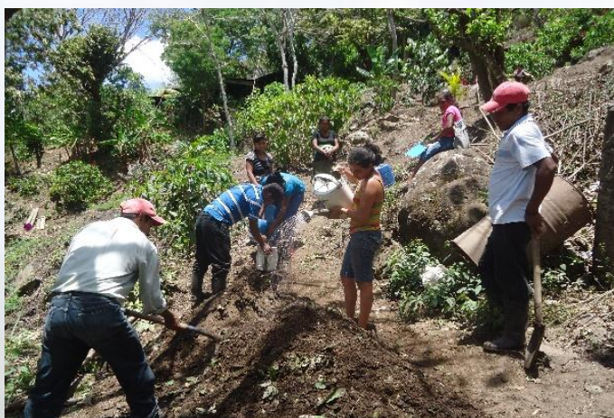
Familias de los barrios en trabajo de huertos.

Es financiado por el Gobierno de Navarra, a través de las gestiones de la fundación Felipe Rinaldi y como una continuidad de proyecto anterior. La meta era beneficiar a 300 familias (60 de comunidades nuevas, 15 de los barrios y 225 de comunidades de seguimiento), pero, se logró llegar a 419 (69 de comunidades nuevas, 17 de los barrios y 333 de comunidades de seguimiento). Las comunidades de seguimiento son San Pablo, Mina Verde 1, Mina Verde 2, Bailadora 1, Bailadora 2, Sabana Grande, El Trentino Obrero, El Carrizo, San Juan; las nuevas El Trentino Cooperativa y El Naranjo; además el casco urbano, familias cercanas al vertedero municipal.