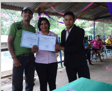
Jóvenes con sus títulos (cursos de INATEC)

Con la participación activa de familias de las comunidades de San Ramón, se llevó a cabo el proceso de recolección de información para la elaboración del plan municipal hasta líneas estratégicas, para un desarrollo municipal participado y planificado, con enfoque bio etno cultural, con asesoría de especialistas en el tema.